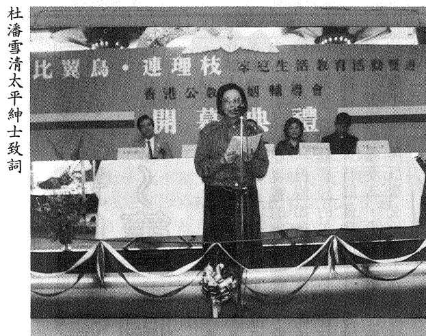
杜潘雪清太平紳士致詞

以在雅緻小屋前拍攝留念。在步出會場前，參觀者均獲贈一本「婚姻青春行」資料手冊。視聽室所播放婚姻、男女心理等題材的電影和幻燈片，繼續吸引着流連忘返的人士。最後，參觀者可在心意角稍作逗留，細心回味與愛人或配偶或家人的溫馨生活，把要傳達的心意，繪畫在心意咭上，大會將選出最有心思的一幅的作者，邀請他們出席閉幕禮的聚餐。同時更歡迎各界人士參與在社聯舉行的兩個研討會與於十二月七日晚上的聚會，以分享促進婚姻感情的心得。 這次推廣雙週能夠順利完成，是本會全體同事再次發揮羣策羣力，團結互助的精神所致。半年來，同事們不辭勞苦，各盡所能，各展所長投入不同的「工作小組」，策劃、推動此項活動。誠如杜潘雪清太平紳士在開幕詞指出，婚姻輔導會是最早在本港推行家庭生活教育機構之一，我們默默將和諧家庭，美滿婚姻的概念傳播。直至政府全力支持家庭教育服務，本會亦率先以社區教育手法，開辦展覽會，講座及印發家庭生活教育資料，本會同工將本着創新而有意義的方法，繼續在本港推行較高質素的家庭生活的目標。